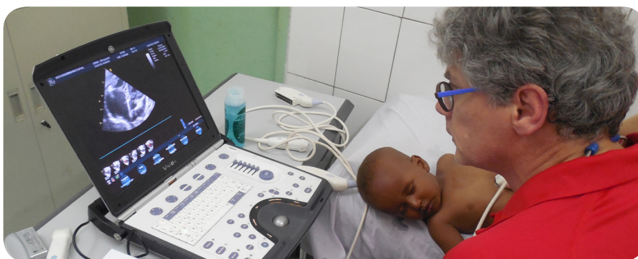
Consultations avec l'appareil d'échographie portable en mission médicale.