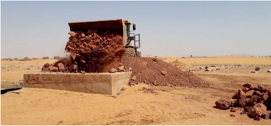
Bouchage des Gros Trous - Essai géotechnique.

Ensuite les équipes procéderont au bouchage de la descenderie, en confectionnant des bouchons en béton armé, aux interfaces entre les différents aquifères traversés par la descenderie et à l'entrée en surface de celle-ci. Ces travaux au fond, sont prévus de s'achever à la fin du mois d'août de cette année. La mine s'ennoiera ensuite naturellement du fait de l'arrêt du pompage.