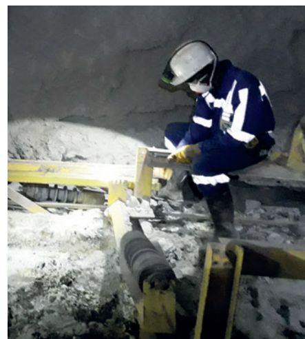
Démantèlement de la bande transporteuse historique de la COMINAK.

La première étape concerne des équipements du fond de la mine (engins miniers, installations de stockage et de distribution des hydrocarbures, convoyeurs) qui doivent être dépollués et stockés selon le mode de stockage défini par le projet. L'objectif est de retirer les sources de pollution potentielles lors de l'ennoyage de la mine. Par ailleurs, certains matériaux électriques pourront être remontés pour réutilisation.