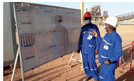
L'animation "Management Visuel", un rituel essentiel pour garantir un bon niveau de qualité et de suivi du planning.

« Une de nos principales préoccupations est la qualité des travaux de réaménagement tant pour assurer la sécurité des équipes qui les réaliseront, que l'atteinte des objectifs de protection de l'environnement et de santé des populations sur le long terme. Pour garantir la performance du réaménagement, les travaux devront être réalisés dans le strict respect des spécifications techniques de mise en œuvre et seront soumis à des contrôles qualité de l'administration et de bureaux indépendants. Le respect du planning reste essentiel dans la mesure où il contribue à la rapidité de sécurisation du site. Nous surveillons en particulier le déroulement du processus achat et l'établissement des contrats afin d'assurer le démarrage des travaux sans retard. »