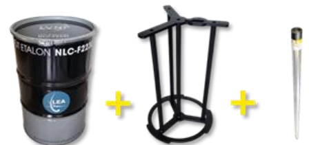
Fût agréé ADR Drum complying with transport regulation rules + Centreur Centering tool + Source linéique Linear source

We can develop the same linear source with other nuclides ( 241 Am, 60 Co, 137 Cs, 133 Ba, alone or mixed) and/or other activities (from 0.0027 to 27 µCi) as well as with other types of barrels.