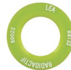
Source gamma / Gamma source (type EGSE)