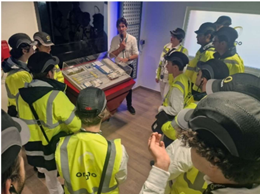
Etudiants ENSAM lors des rencontres du 9 et 16 novembre 2023