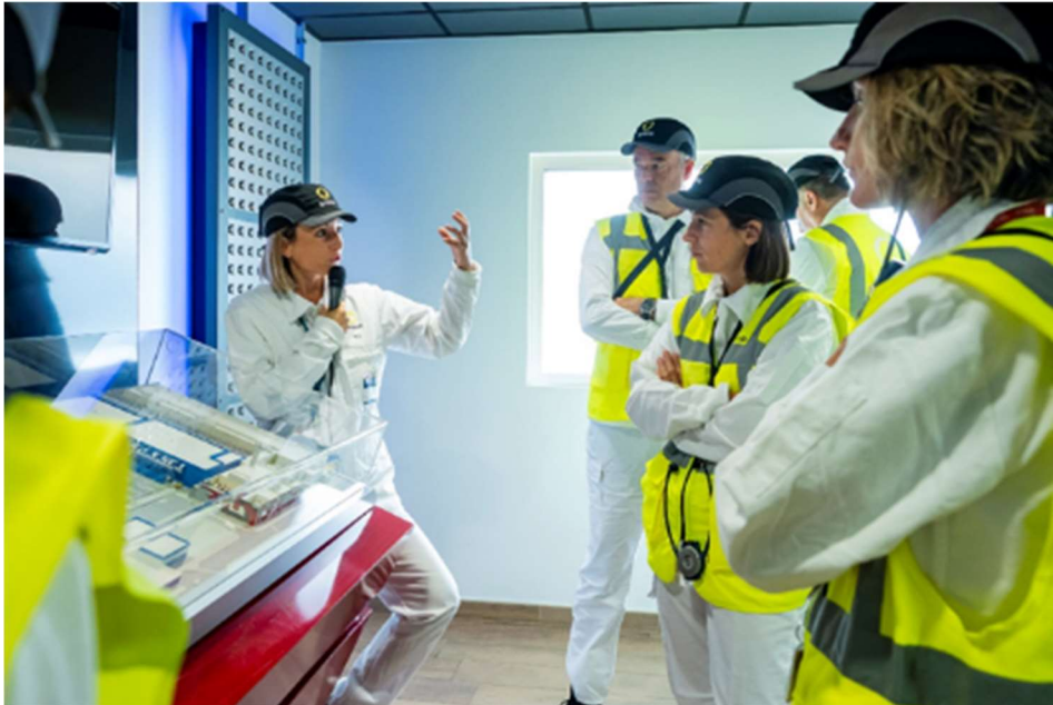
Rencontre et visite de l'usine d'enrichissement Georges Besse 2 – S.Binet

L'organisation de la visite du site GB2 avec la participation de la secrétaire générale de la CGT , Sophie Binet, était axée sur l'augmentation des capacités de l'enrichissement et s'est tenue avec 10 représentants de la CGT.