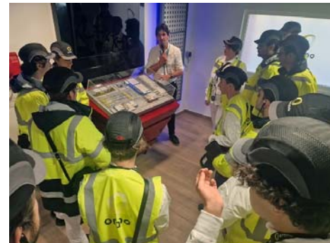
Visites d'étudiants de l'usine GB2 – octobre/novembre/décembre