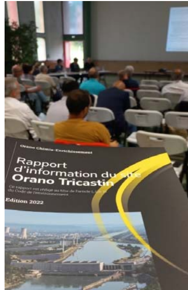
Publication rapport annuel juin 2023