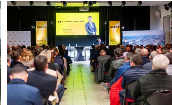
Rendez-vous entreprises partenaires 16 novembre Donzère

Information du public via compte X (twitter) @OranoTricastin et site internet du projet : www.projetextensiongb2.fr