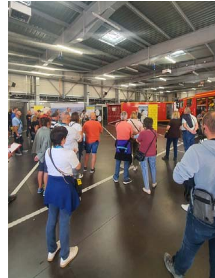
Visite du public 13 octobre 2023