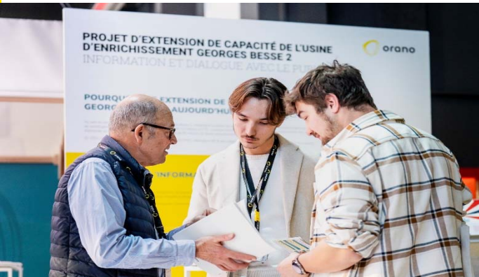
Convention salariés Orano Chimie-Enrichissement 20 décembre 2023