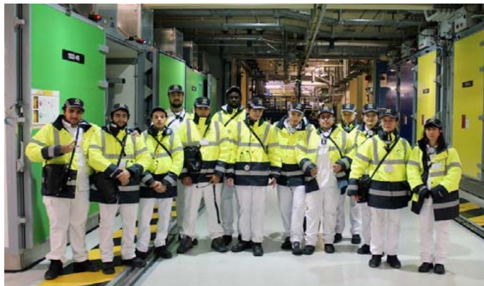
Visite étudiants Lycée des Catalins (Montélimar) – 13 décembre 2023