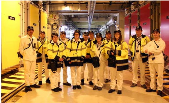
Visite usine GB2 avec membres CLIGEET - 14 novembre 2023