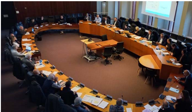
Réunion plénière CLIGEET – 29 novembre 2023