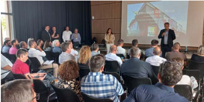
Réunion d'information le 8 juin 2023 avec entreprises locales